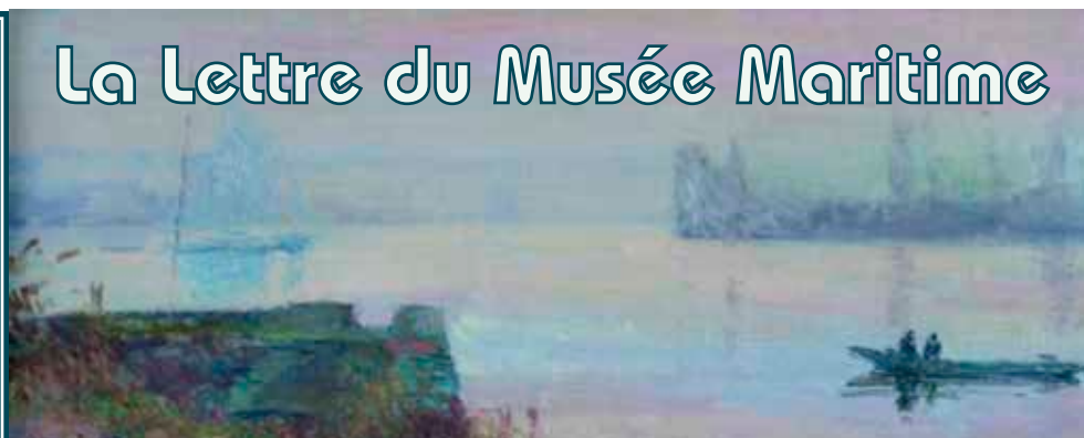
Joseph Delattre (Déville-lès-Rouen 1858 - Petit-Couronne 1912) La Cale de Petit-Couronne, vers 1908