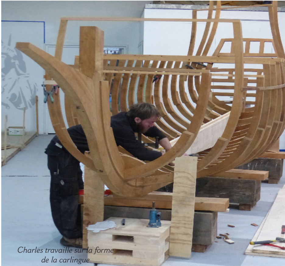
Charles travaille sur la forme de la carlingue

Quand la « Dauphine » sert à former des Compagnons à la Charpente maritime.