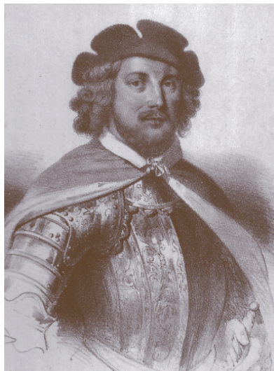
Le précurseur des grands navigateurs normands.

Peuplées depuis 5000 ans, à la suite de plusieurs vagues d'immigrants d'origine nord africaines, les îles Canaries sont connues déjà en 465 avant J.C. par les Phéniciens (Hamon de Carthage les nomme Fortunées).